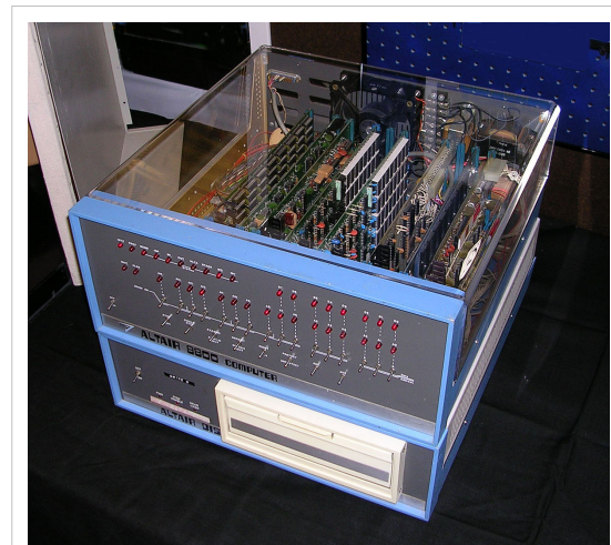
1975: Altair 8800

El Altair fue introducido en un artículo de la revista Popular Electronics en la edición de enero de 1975. Similarmente a los proyectos anteriores de MITS, el Altair fue vendido en forma de kit, aunque uno relativamente complejo consistiendo de cuatro placas de circuito y muchas partes. Valorado en solamente $400, el Altair sorprendió a sus creadores cuando generó miles de órdenes en el primer mes. Incapaz de manejar la demanda, MITS eventualmente vendió el diseño después de que cerca que 10.000 kits de equipos fueron despachados.